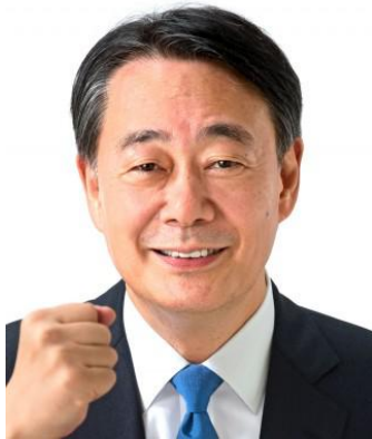
海江田万里衆議院副議長

コロナ感染症により2020年1月から中断していた日中の国会議員(中国は全人代)交流の再開を目指し、今月22日から26日までの日程で海江田衆議院副議長をトップに、自民党や共産党議員を含め超党派の国会議員が訪中を計画している。