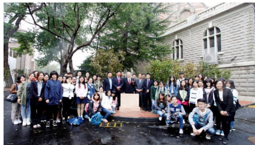
—天津外国語大学に桜の植樹と 千葉県天津市青年友好の碑設置記念撮影—