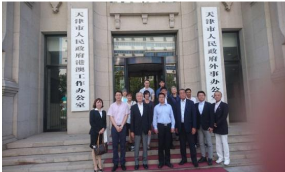
—天津市人民政府外事弁公室訪問—